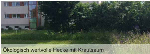
Ökologisch wertvolle Hecke mit Krautsaum

Mit der Pflanzung von Einzelsträuchern in Ihrem Garten respektive der Aufwertung oder sogar Neupflanzung einer Hecke bereichern Sie unser Hinwiler Landschaftsbild und bieten vielen einheimischen Tier- und Pflanzenarten einen wertvollen Lebensraum. Damit die Heckensträucher bzw. Hecken ihre vielfältigen Funktionen als Windschutz, Überwinterungs- oder Fortpflanzungsorte erfüllen können, müssen sie fachgerecht gepflanzt und gepflegt werden.