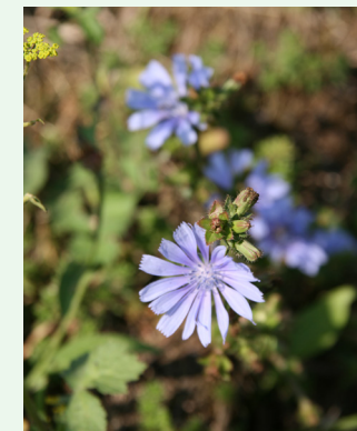
Wegwarte Cichorium intybus