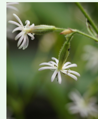
Nickendes Leimkraut Silene nutans