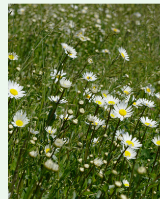
Gew. Wiesen-Margerite Leucanthemum vulgare